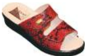
35/42 D1575 ROUGE | MARINE | BEIGE

Mule cuir avec double scratch assurant un maintien parfait du pied. La semelle polyuréthane est antichoc.