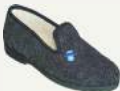
39/46 GASTON GRIS

Charentaise élastiquée en pure laine, doublée laine, semelle P.U