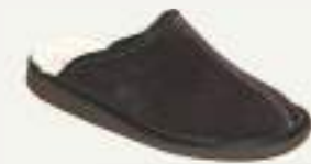
39/46 ELEAZAR MARRON