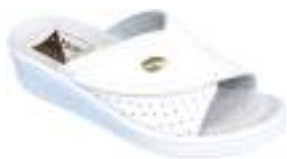
35/42 D1399 BLANC

Mule cuir à scratch intégral assurant un maintien parfait du pied. La semelle polyuréthane est antichoc.