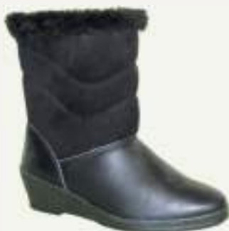
35/42 LISA NOIR

Bottine en croute fourrée sur un talon compensé.