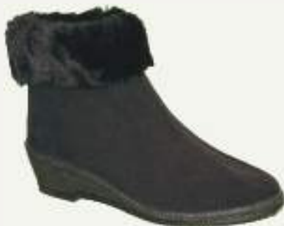
35/42 EVA NOIR

Bottine fourrée à double scratch sur talon compensé. La matière déperlante la rend quasiment étanche.