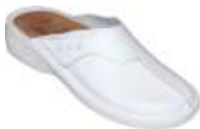
35/42 5693 BLANC | NOIR

Mule tout cuir à scratch avec une semelle polyuréthane anti choc. La semelle est réversible, soit cuir, soit avec des picots de massage