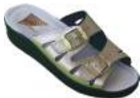
35/41 D1664 BRONZE | OR

Mule cuir avec deux boucles réglables assurant un maintien parfait du pied. La semelle polyuréthane est antichoc.