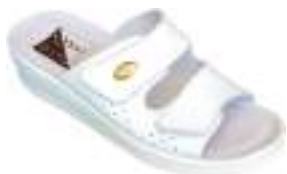
35/42 M1375 MARINE | BLANC

Mule cuir avec double scratch assurant un maintien parfait du pied. La semelle polyuréthane est antichoc.