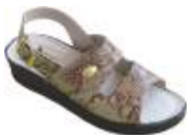
35/42 D1576 BEIGE | MARINE

Sandale cuir avec double scratch et bride arrière réglable. La semelle polyuréthane est antichoc.