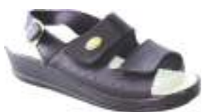
35/41 D1376 MARINE | BLANC

Ce sabot cuir avec bride arrière réglable, d'un grand confort, est monté sur une semelle polyuréthane et antichoc. Un bourrelet de maintien vient assurer un excellent maintien du pied.