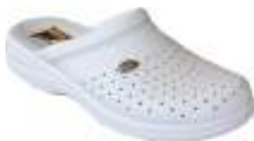
39/46 D1750 BLANC | MARINE

Ce sabot homme Anatomic est monté sur une semelle polyuréthane et antichoc. Un bourrelet de confort assure un excellent maintien du pied.