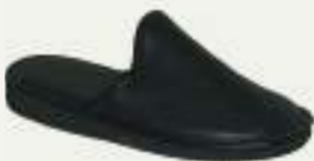
39/46 LAURENT NOIR

Mule cuir doublée laine, semelle micro pour un poids plume.