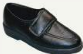
35/46 R1402 NOIR

Bottillon élastiqué en pure laine, semelle P.U. Grand confort.