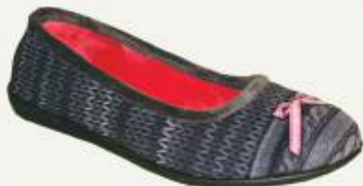
35/42 CARLA GRIS