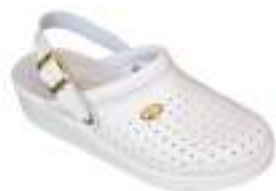
35/42 D1346 BLANC

Ce sabot cuir avec bride arrière réglable d'un grand confort, est monté sur une semelle polyuréthane et antichoc. Un bourrelet de maintien vient assurer un excellent maintien du pied.