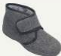
39/46 205 GRIS

Charentaise fantaisie en pure laine, semelle P.U.