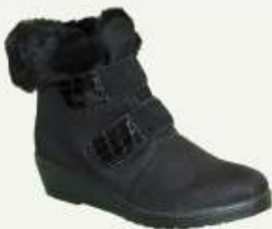
35/42 LEA NOIR

Bottine fourrée à double scratch sur talon compensé. La matière déperlante la rend quasiment étanche.