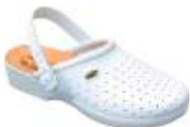
35/46 S2323 BLANC

Sabot cuir Saniflex aux normes EN347, antistatique.